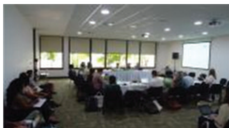
Sesión sobre Soluciones locales para la justicia ambiental

Los oradores abordaron estrategias locales para superar el modelo hegemónico capitalista del uso de los recursos naturales. En los debates, se llamó la atención sobre dos puntos clave. Primero, el derecho a ser diferente y la importancia de reconocer distintas imágenes de naturaleza y prácticas de acceso y aprovechamiento de los recursos naturales. Segundo, la homogenización de prácticas y relaciones conduce no sólo a injusticias sociales sino también al empobrecimiento socioambiental que deriva en vulnerabilidades en los ámbitos local y global.