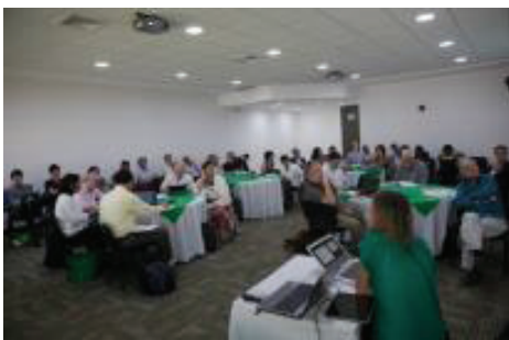
Sesión sobre pensamiento socio-ambiental latinoamericano y debates conceptuales

En esta sesión se demostraron los orígenes y el desarrollo del pensamiento ambiental latinoamericano. Con sus inicios a principios del siglo XX, se desarrolló rápidamente después de la década de 1960. Aunque siempre estuvo conectado a debates globales sobre cuestiones ambientales, mantuvo sus características específicas determinadas por la abundancia de recursos y la densidad de población relativamente baja.