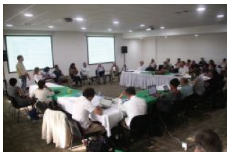
Mesa redonda: 'Producción de saberes y gobernanza ambiental'