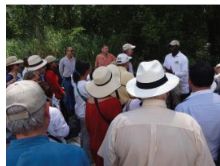
Visita de campo previa a la conferencia, a planta de tratamiento de aguas residuales (PTAR-MINSA) y su proyecto de restauración de manglar