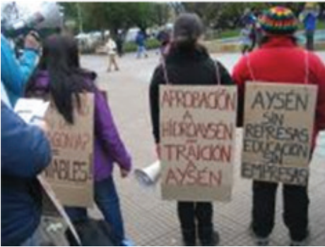
Mobilización anti-represa en la Patagonia chilena (foto y presentación en mesa redonda sobre Justicia Ambiental: Gloria Baigorrotegui)