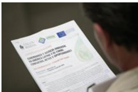
Programa de la conferencia