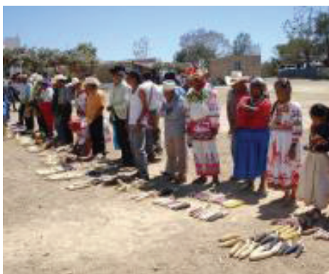
Un estudio sobre la conservación de maíz criollo en México (foto y presentación en la sesión Soberanía Alimentaria: Jean Foyer)

Las relaciones entre la sociedad y la naturaleza, y el nexo entre producción, desarrollo sustentable y el fin de la pobreza y la marginalización fueron las claves de esta sesión. Las experiencias con los sectores de hidrocarburos y minería muestran que la gobernanza ambiental de estos recursos presenta grandes desafíos, pues involucra una cantidad de actores e intereses diferentes. Al mismo tiempo, los modelos de desarrollo basados en sectores extractivos han sido bastante rígidos, como así también los problemas socio-ambientales. Para mejorar la calidad de vida, lo que se necesita es ciencia y desarrollo integral, sobre la base del potencial y la protección tanto de recursos naturales como humanos.