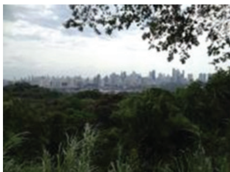
Naturaleza y desarrollo urbano: Vista de la ciudad de Panamá desde su Parque Metropolitano

La conferencia tuvo dos modalidades de presentación: mesas redondas con actores clave, y sesiones académicas, para estimular el diálogo entre académicos y una variedad de actores en el sector público, la sociedad civil (ONG y movimientos sociales) y el sector privado. A continuación se presenta un breve resumen de las mesas redondas y sesiones. Para ver información más detallada y acceder a las presentaciones, visitar: www.engov.eu/conferencia_vivo.php .