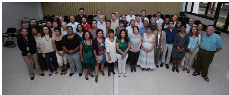
Participantes de la Conferencia ENGOV en Panamá

Este proyecto ha recibido financiamiento del Séptimo Programa Marco de la Unión Europea para acciones de investigación, desarrollo tecnológico y demostraciones en virtud del Convenio de Cooperación No. 266.710.